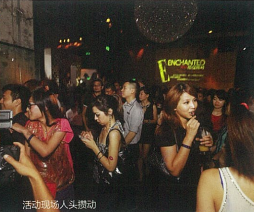
活动现场人头攒动